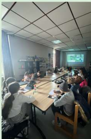
RÉUNION DU CME