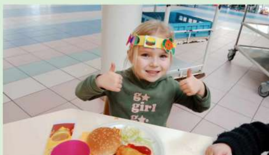
REPAS "FISH BURGER"