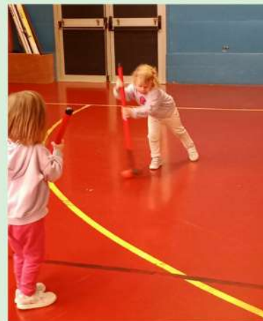
INITIATION AU HOCKEY