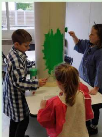
PRÉPARATION DES DÉCORATIONS DU PROCHAIN "GAMING DAY"