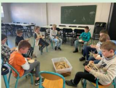
DÉCOUVERTE DU TRESSAGE DE ROTIN